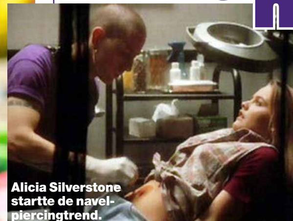
Alicia Silverstone startte de navelpiercingstrend.