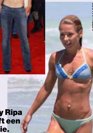
Kelly Ripa heeft een outtie.

volgens wordt de navel weer op de oorspronkelijke plaats gebracht.